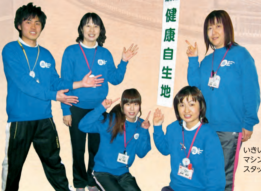
いきいき広場 マシンスタジオ スタッフのみなさん